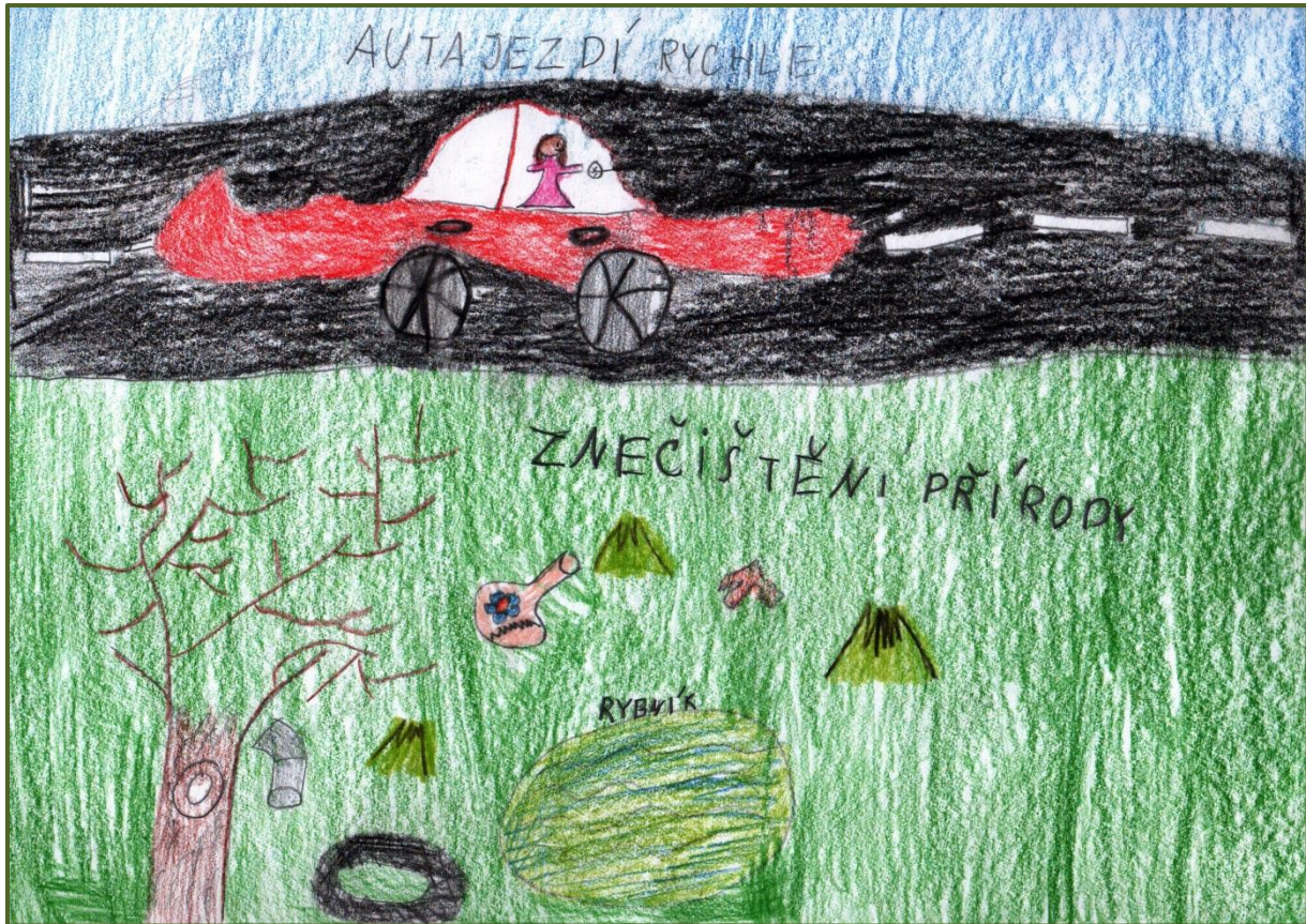
Obrázek č. 5: Markétě z Nižních Lhot vadí intenzivní doprava a znečištění přírody 10

Prioritami Nižních Lhot by podle zapojených měly být volnočasové atraktivy (nejrůznějšího druhu), hřiště, koupaliště (nebo cokoli ke koupání), maloobchod, stravování (včetně restaurací), další občanská vybavenost a silnice.