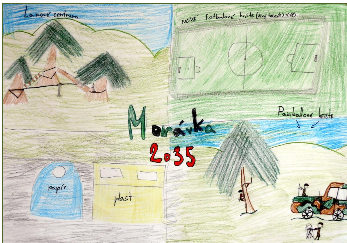
Obrázek č. 4: Děti z Morávky zpracovaly vlastní strategický plán obce 8

Dále cyklostezky, silnice, maloobchod, kroužky a kino.