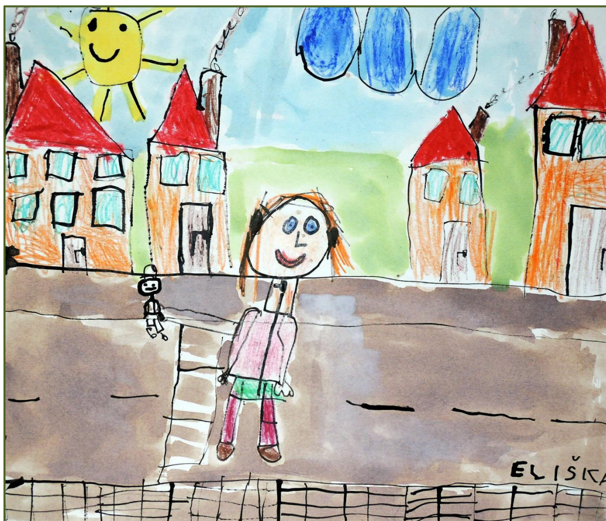
Obrázek č. 7: Elišce chybí na Pražmě přechod pro chodce 12

Dále společenské, kulturní a sportovní akce, kroužky, cyklostezky, mobiliář (lavičky apod.), veřejná zeleň (park), ordinace lékaře, lékárna, restaurace s dovážkou jídel a sauna.