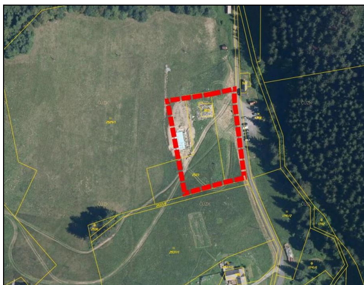
Vymezení plochy P1/2 na výřezu z ortomapy

Dále jsou Změnou č. 1 vymezeny zastavitelné plochy dopravní infrastruktury – silniční DS Z45 až Z55. Jde o plochy, které jsou v platném územním plánu vymezeny pro výstavbu parkovišť, nejsou ale označeny jako zastavitelné a nemají číselné označení; kromě toho je část z nich vyznačena jako navržené plochy veřejných prostranství – s převahou zpevněných ploch PV a část jako plochy dopravní infrastruktury – silniční DS. Změnou č. 1 je tento nesoulad odstraněn, všechna navržená parkoviště jsou vymezena jako zastavitelné plochy dopravní infrastruktury – silniční DS (plochy parkovišť nelze chápat jako veřejná prostranství dle zákona o obcích) a číselně označeny.